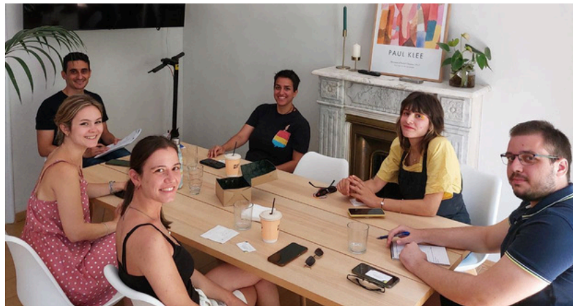
Focus group con giovani in Grecia

Per lo sviluppo del materiale formativo e della logica di intervento YES-SI, i partner in Germania, Grecia, Italia e Spagna hanno organizzato focus group con giovani e portatori di interessi delle organizzazioni giovanili, insieme a un sondaggio online rivolto ai giovani. Gli approfondimenti, i punti di vista e le opinioni dei giovani e delle parti interessate aiuteranno i partner a identificare i bisogni e le caratteristiche sia dei gruppi target che del contesto sociale. I risultati della ricerca sul campo consentiranno poi ai partner di creare strumenti e metodi su misura e adattati per aiutare i giovani a co-creare il cambiamento sociale nella pratica.